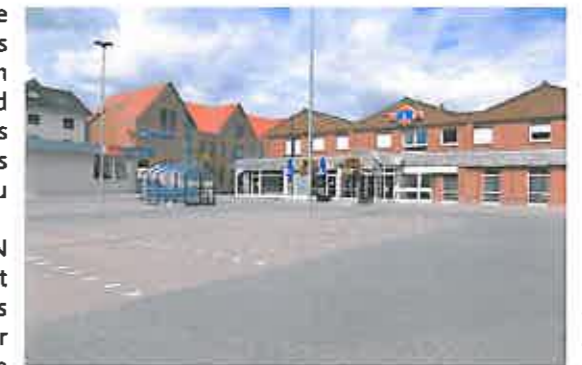
-An alle Haushalte-