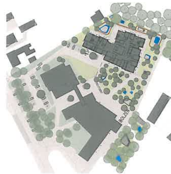
Ein möglicher Plan für das Gelände an der Waldschule und dem Kindergarten von der Firma frei[RAUM]planung, bissendorf